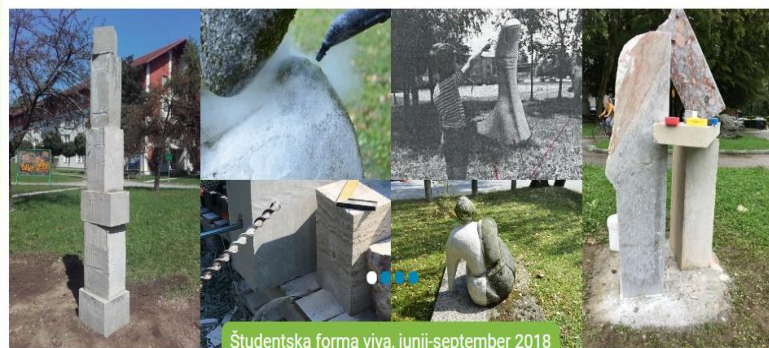
Študentska forma viva, junij-september 2018

DOMOVI ▾ DOM PODIPLOMCEV ▾ BIVANJE ▾ ŠPORT IN ZDRAVJE ▾ TURIZEM ▾ PROJEKTI ▾ ZAVOD ▾